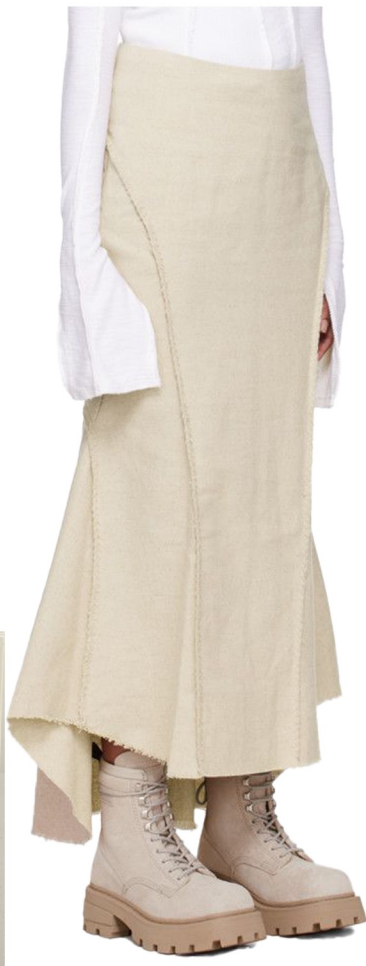
mermaid long skirt 트위드 원단사용 머메이드실루엣 롱기장 데끼컷팅 디테일 살리기 밑단 언발 제거