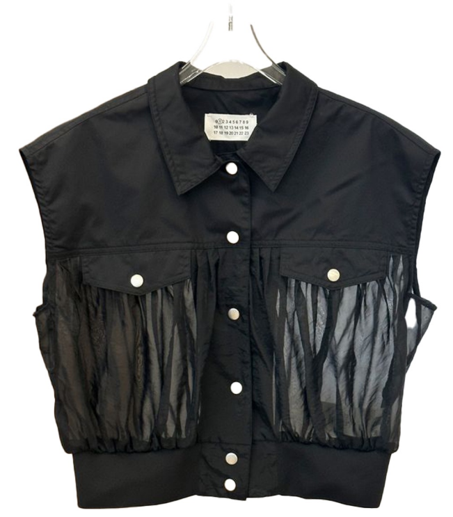
fabric block vest

코튼 섞인 화섬원단 사용 타이트핏 크롭기장 집업 유지-투웨이 지퍼 사용 소매핀턱 위치이동-소매중심 핀턱 넣기 가슴 웰트포켓 제거