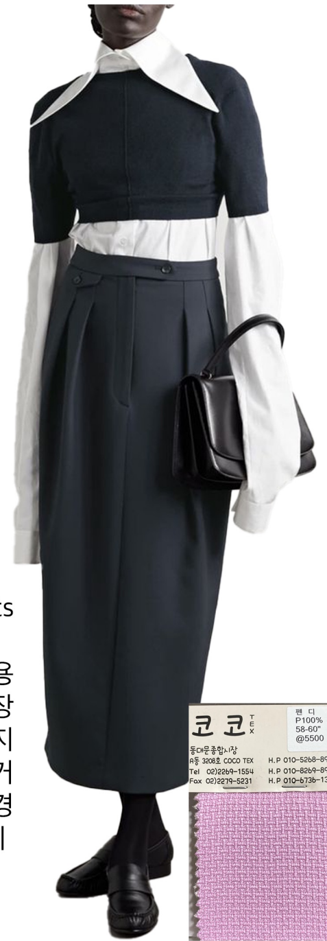
pencil long skirts 조직감 있는 원단 사용 펜슬실루엣 롱기장 앞판 주름 유지 오비아래 플립 제거 덩고 기본으로 변경 단추제거-마이깡달기