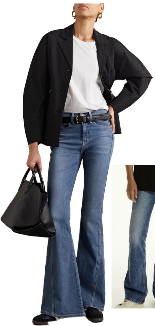
flare denim pants

스판 함유된 데님원단 사용 슬림한 플레어핏 와끼절개 넘어오기 워싱 살짝 더 주기(사진참고)