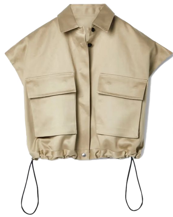
glossy cargo jacket

메란지 느낌의 화섬원단 사용 레귤러핏 기본기장 칼라리스 네크라인 가슴에 웰트포켓 하나 넣어주기 플랩포켓에서 웰트포켓으로 변형