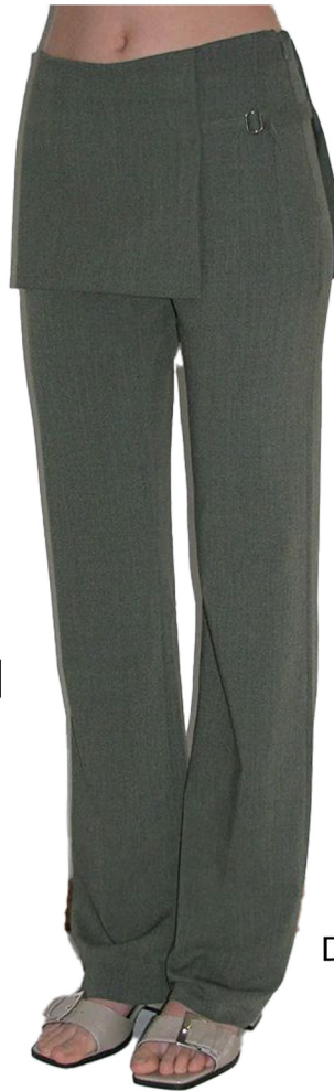
pintuck denim pants

트류의 화섬원단 사용 부츠컷핏 롱기장 랩스커트 레이어드 디케일 유지 랩 쪽 벨트 1개 추가-2줄로 가기 제원단 싸게 벨트강으로 변형 랩기장 클러치 덮기 와끼여밈-10“혼솔지퍼