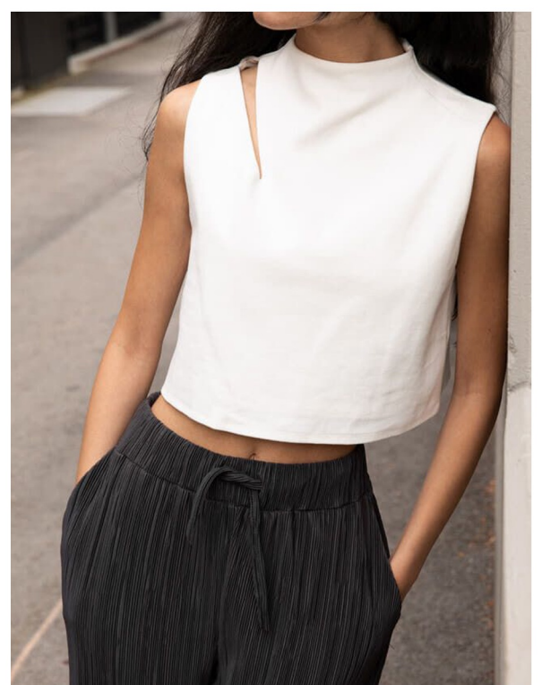
slit crop top

요루지 원단 사용 루즈핏 기본기장 A라인 실루엣 halter넥 유지 랍빠부분 컬러배색 하기