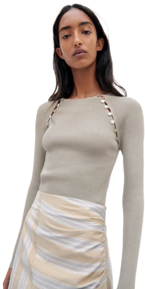
button point knit

얇은 다이마루 원단 사용 타이트핏 크롭기장 소매 하프슬리브로 변형(돌맨형태) 밑단 쪽에 자수 또는 팬던트 포인트 주기