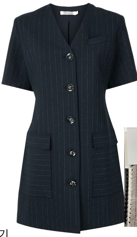
linnen stripe dress

린넨 스트라이프 원단 사용 A라인 실루엣 미니기장 폭 넓지 않은 노치드카라 달기 단추 크기 작은거로 달기 가슴 웰트포켓 일자로 달기 제티드 포켓으로 변형