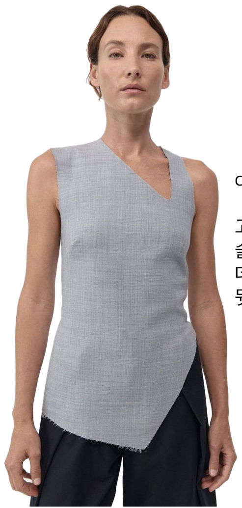
cutting sleeve top

고시감 있는 원단 사용 슬림핏 언발기장 데끼컷팅 포인트 살리기 뒷중심 절개 + 혼솔지퍼 여밈