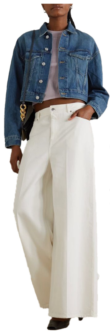
cotton wide pants

면 7-10수 원단 사용 와이드핏 롱기장 피그먼트 원단으로 컬러트인트 레직기 잡기