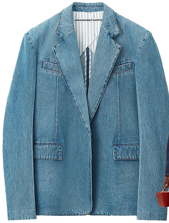
denim taioered jacket

TR류의 화섬원단에 합포해서 사용 슬림핏 미니기장 카라유지 또는 노치드카라로 변형 제원단 벨트강으로 변경