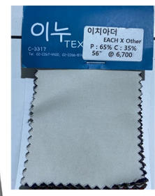
A line slit skirt 면폴리 화섬원단 사용 A라인 실루엣 롱기장 앞판 슬릿 유지 와끼주머니로 변형 레직기제거-핀턱으로 변형