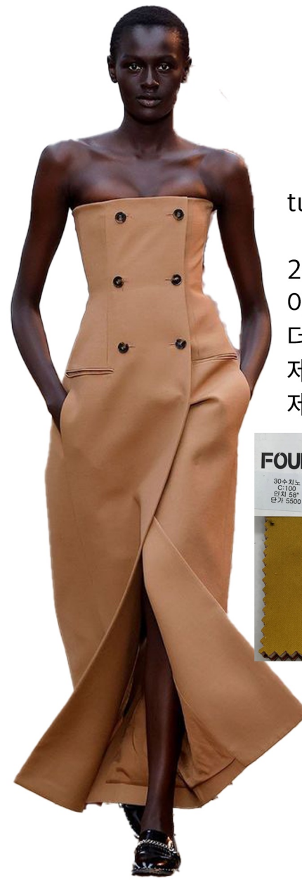
tube double breasted dress

20-30수 면트월 원단 사용 아워글래스 실루엣 롱기장 더블브레스티드 제티드포켓 제거 제원단 탈부착 어깨끈 만들어 주기