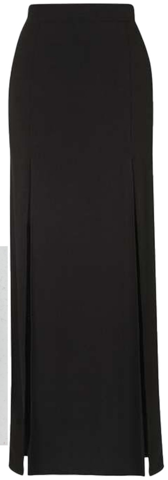
double slit skirt 트류의 화섬원단 또는 린넨혼방원단 사용 h라인 실루엣 롱기장 앞판 양쪽으로 트임 길게 넣기