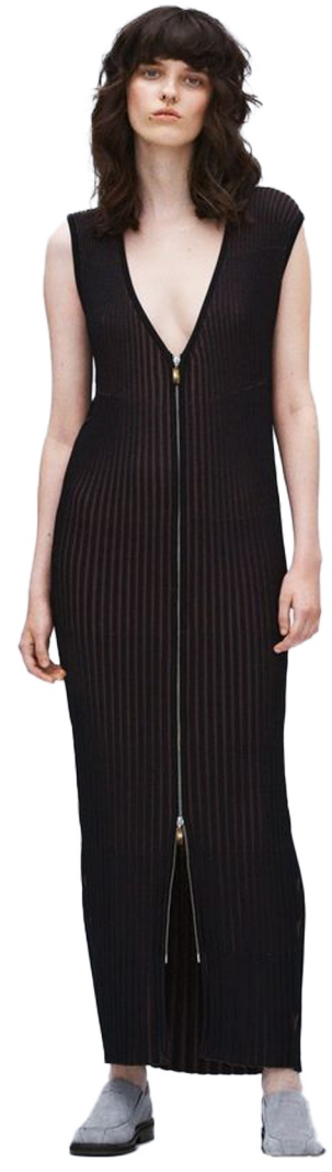
zip up knit dress

린넨 데님 원단 사용 A라인 실루엣 롱기장 앞목깊이 올려주고 홀터넥 유지 앞중심 지퍼 제거 -뒤판 중심 지퍼 여밈으로 변경