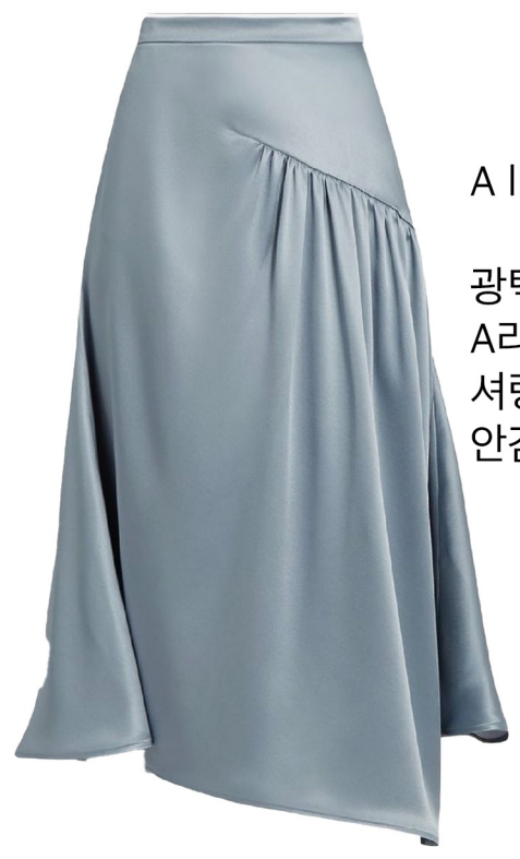
A line shirring point skirts 광택나고 흐르는 원단 사용 A라인 실루엣 미디기장 셔링 디테일 살리기 안감 스트레치 사용