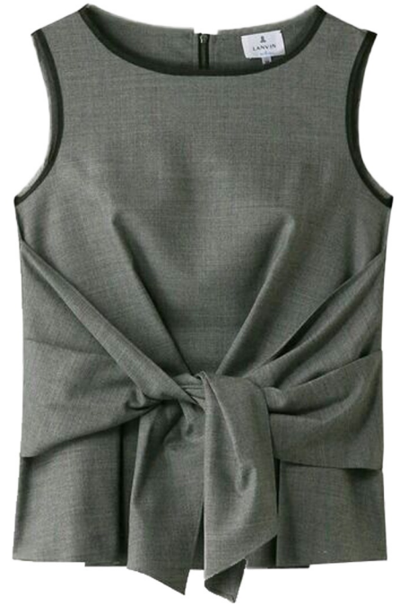
waist tie blouse

고시감 있는 원단 사용 슬림핏 언발기장 데끼컷팅 포인트 살리기 뒷중심 절개 + 혼솔지퍼 여밈