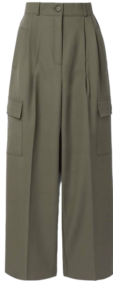
wide cargo trouser

화섬원단 사용 와이드핏 롱기장 포켓디테일 살리기 밴딩쪽 끈 나오는 부분 금속 아일렛 치기 끈 끝부분 금속팁 마감하기