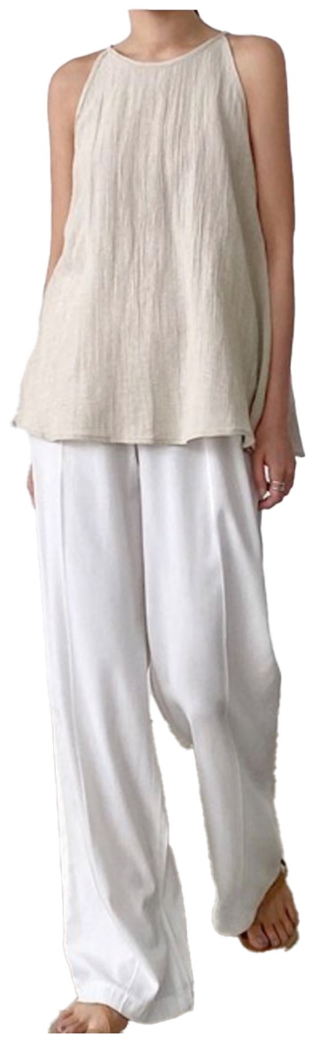
halter wrinkel blouse

시스루 원단 사용 루즈핏 기본기장 시스루원단 이중 레이어드 시보리부분 폴리요꼬로 변경 넥라인 컬러매칭