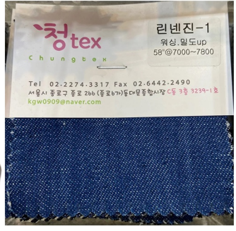
linnen denim dress

린넨 데님 원단 사용 A라인 실루엣 롱기장 앞목깊이 올려주고 홀터넥 유지 앞중심 지퍼 제거 -뒤판 중심 지퍼 여밈으로 변경