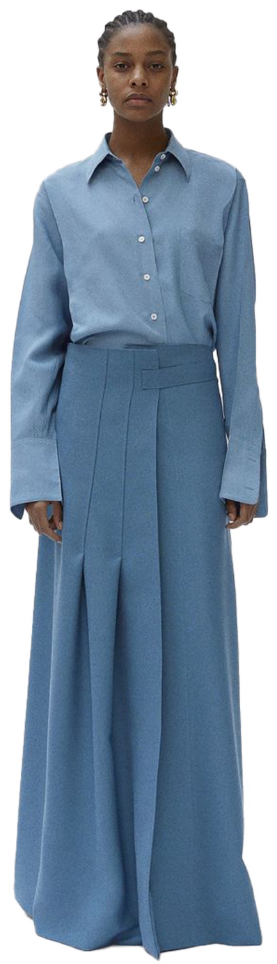
unbalance wrap skirts 16-20수 데님원단 사용 슬림핏 롱기장 랩형식 스커트 주름디테일 살리기 데님컬러 라이트하게 사용