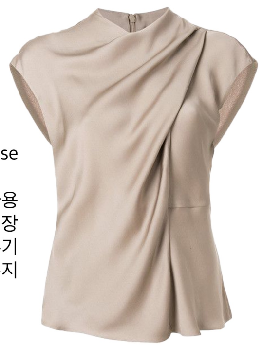
drapped satin blouse

린넨원단 사용 레귤러핏 크롭기장 어깨 슬릿포인트 넥라인 라운드로 변형 밑단 라운드 굴리기 하프슬리브달거나 슬리브리스 유지