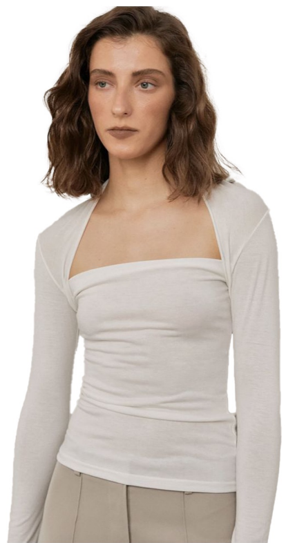
bolero layerd t

부드럽고 스팩기 있는 원단사용 타이트핏 기본기장 소매기장 짧은 하프슬리브로 변형