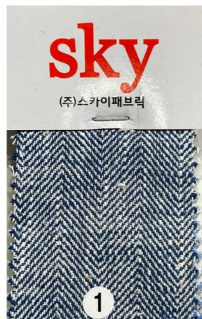
LINNEH HERRINGBORN TOP

체크무늬 또는 솔리드 린넨스판 원단사용 타이트한 슬림핏 크롭기장 여밈 변형-지퍼달기