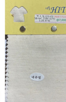
UNBALNCE LINNEH TOP

린넨레이온 원단 사용 어깨꿈 길이 조절 가능하게 변형 가슴에 톤온토 자수 포인트 주기