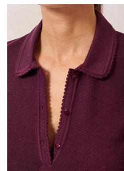
SLIM POLO KNIT

면 스판 혼방 원사 사용 골지조직으로 짜기 슬림핏 기본기장 카라&단작 스칼럽 포인트 추가 소매 캡소매로 변형