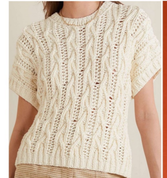
CABLE KNIT VEST

린넨혼방 원사 사용 크롭기장으로 변형 트위스트조직 포인트 밑단에 금속 팬턴트 포인트