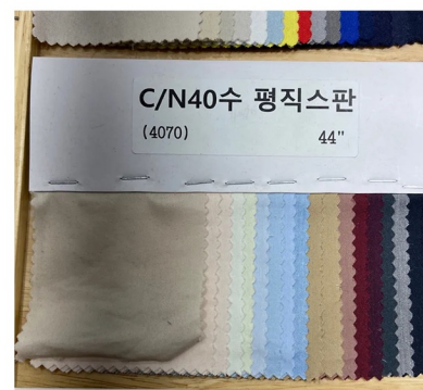
COTTON SPAN DRESS

면스판 또는 면혼방스판 원단 사용 네크라인 보트넥으로 변형 스커트부분 셔링으로 변형