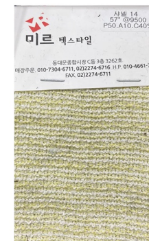
TWEED COMBI DRESS

TR스판류의 혼방원단 사용 홀터넥 디테일 유지-버클제거 단추로 변형 스커트기장 미디기장으로 키우기