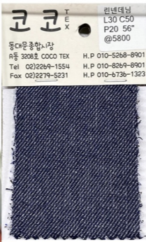
LINNEN DANIM SKIRTS

린넨데님 원단 사용 머메이드라인 롱기장 사진과 같은 컬러와 인디고컬러 두가지 진행 스티치컬러 화이트로 포인트