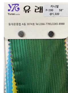
TEXTUER SATIN TOP

린넨레이온 원단 사용 어깨꿈 길이 조절 가능하게 변형 가슴에 톤온토 자수 포인트 주기