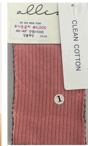
METAL POINT SLEEVELESS