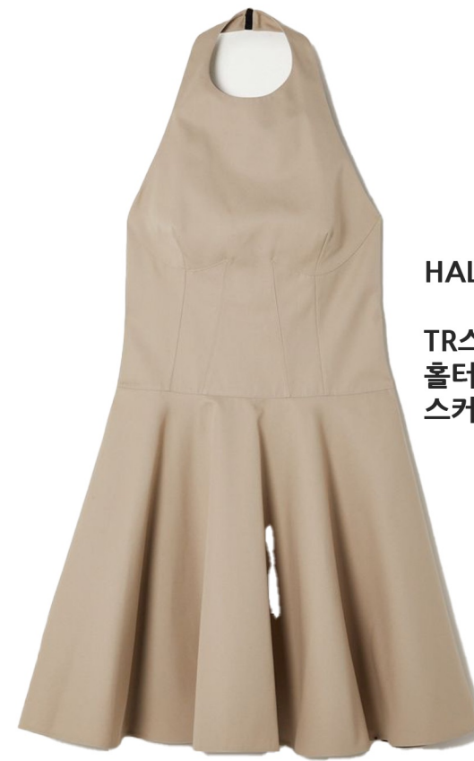
HALTER NECK DRESS

면스판 또는 면혼방스판 원단 사용 네크라인 보트넥으로 변형 스커트부분 셔링으로 변형