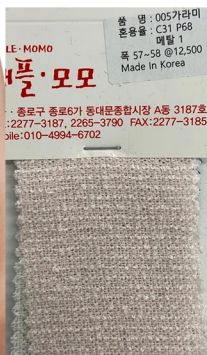
TWEED TUBE DRESS

톤온톤 트위드 원단 사용 단추 갯수 줄이기-금속단추로 포인트 플립포켓수정-웰트포켓으로 변형