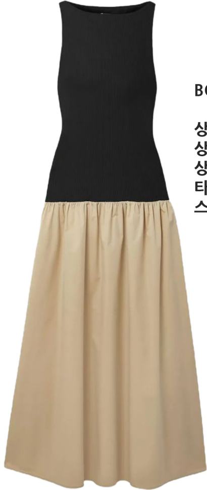
BOAT NECK BLOCK DRESS

상의부분 니트/스커트부분 60수고밀도 사용 상의 탄탄한 골지조직 상의 슬림핏 로우웨스트 타이트한 5부 소매 달기 스커트 셔링 많이 넣을 것